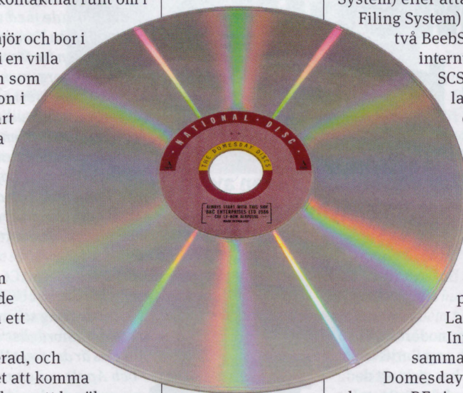
▲ En av skivorna som gavs ut för Domesday-projektet.

Vad väntar i framtiden då? När allt fungerar perfekt och alla bitar är på plats är planen att bygga en mer "konsumentvänlig" lösning, kanske baserad på en Raspberry Pi eller liknande. Arbetet pågår ständigt och vi ser onekligen fram emot slutresultatet. Du kan läsa mer om utvecklingen på länkarna nedan. ■