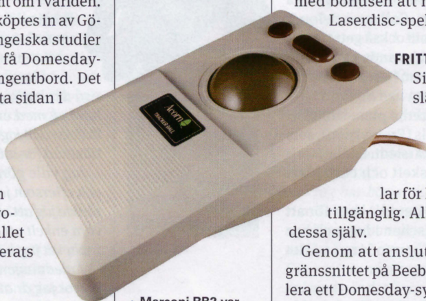
▲ Marconi RB2 var namnet på den specialbeställda styrkulan för Domesday-projektet.